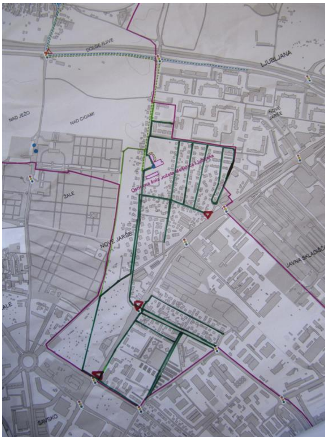
Slika 1: Varna šolska pot